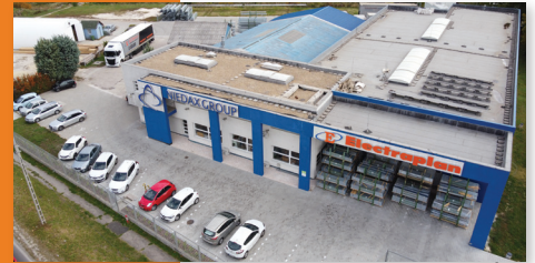
Zentrale in Érd